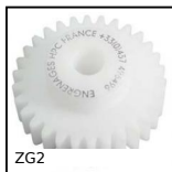
ZG2 Ingranaggio dritto in plastica, Plastica lavorata (delrin)