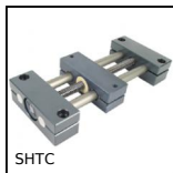
SHTC Tavola lineare Drylin®, Nessuna manutenzione