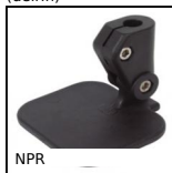
NPR Morsetto porta catarifrangente,