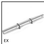
EX Albero per riduttori E, Albero doppio per riduttori E