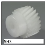
SH3 Ingranaggio elicoidale ad assi paralleli, Plastica lavorata (delrin)