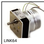
LINK64 Motoriduttore AC sincrono, da 1.3 a 6Nm