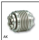
AK Giunto a soffietto Gerwah®, da 36 a 800Nm