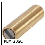
PLM-20SC Magnete cilindrico, Magnete cilindrico