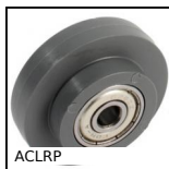
ACLRP Rullo per profilati, Con cuscinetto a sfere