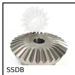
SSDB Ingranaggio conico inox, 2:1