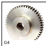
G4 Ingranaggio dritto acciaio , Acciaio 20NCD2