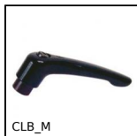
CLB_M Maniglia a ripresa, Zamak