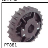
PT881 Pignone di trazione, Serie 881