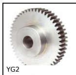
YG2 Ingranaggio dritto PRESTAZIONE, Acciaio 35NCD6