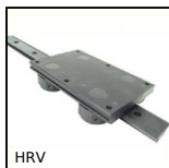
HRV Sistema di guida su binario a V Simple Select®, Binario con carrello