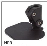
NPR Morsetto porta catarifrangente,