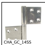
CHA_GC_14SS Cerniera a bandiera inox, Ad avvitare