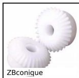
ZBconique Ingranaggio conico in plastica, 1:1