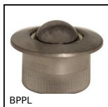
BPPL Mini sfera portante a incastro, A incastro