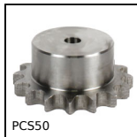
PCS50 Pignone a catena - acciaio, 12.7mm (DIN08B-1)