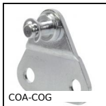
COA-COG Staffa di montaggio per molla a gas, Staffa di montaggio piana per f...