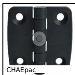
CHAEpac Square decorative screwed hinges, carbon fibre reinforced