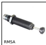
RMSA Deceleratore, Regolabile