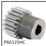
PSG125HC Ingran. dritto di precisione trattato skiving, Acciaio 20NCD2 cement...