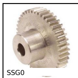
SSG0 Ingranaggio dritto Inox, Inox 304L