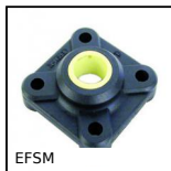
EFSM Cuscinetto a flangia quadrata Igubal®, Polimero