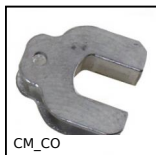
CM_CO Attrezzi Hygienic Usit® and Hygienic Design®, Protective inserts f...