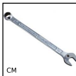
CM Attrezzi Hygienic Usit® and Hygienic Design®, Protective inserts f...