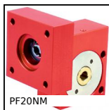
PF20NM Riduttore a ruota e vite senza fine, fino a