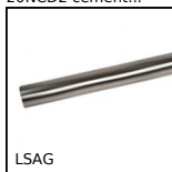
LSAG Albero scanalato a sfere, Binario - da 514 N a 15386 N