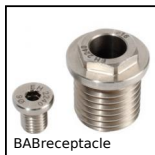
BABreceptacle Perno autobloccante, Bussola di innesto