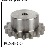
PCS8ECO Pignone a catena - acciaio, 8mm (DIN 05B-1)