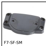
F7-SF-SM Visualizzatore multifunzione, Supporto - montaggio frontale