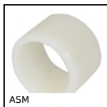
ASM Cuscinetto cilindrico, Polimero alimentare