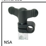
NSA Connettore rinvio d'angolo, Articolato