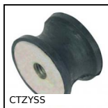
CTZYSS Antivibrante elastico inox sgolato, Inox