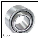
CSS Snodo sferico, acciaio/acciaio autolubrificante