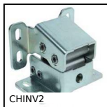
CHINV2 Cerniera invisibile, Invisible - Apertura fino a 125°