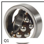
Q1 Cuscinetto orientabile a sfere, Acciaio