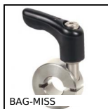
BAG-MISS Anello di serraggio con intaglio e maniglia a leva, Inox