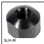
SLH-M Dado per bloccaggio a leva, Dado con