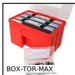
BOX-TOR-MAX Valigetta di guarnizioni toriche in