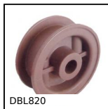
DBL820 Rotella per catena, Serie 820 e 815