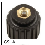
GSI_A Vite di regolazione per molla a gas, Vite di regolazione