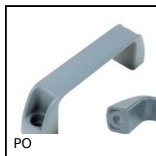
PO Maniglia a ponte - Multi-settore, Foro liscio