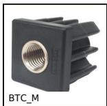
BTC_M Tappo per tubo quadrato con inserto maschiato, Con inserto maschiato