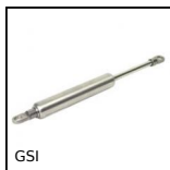
GSI Molla a gas inox, Inox