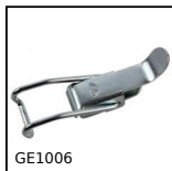
GE1006 Chiusura a leva adattabile, Per aggancio in gola