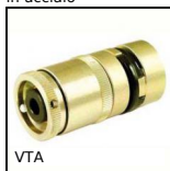
VTA Limitatore di coppia ad attrito Vari-Tork®, 0.53 a 1.32 Nm