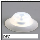
DFG Ventosa, silicone