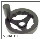
V3RA_PT Volantino a tre razze, Poliammide