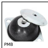
PMB Supporto antivibrante a campana, Piastra a base ovale