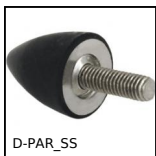
D-PAR_SS Piedino antivibrante parabolico, inox