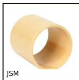
JSM Cuscinetto cilindrico, Polimero universale