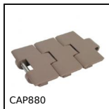
CAP880 Catena a tapparella, Stretta serie 880