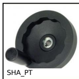
Volantino pieno, Poliammide