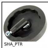
Volantino pieno, Poliammide