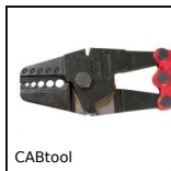
Attrezzi per cavi, Attrezzi per crimpatura