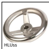
Volantino a razze, Inox 316