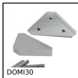
Kit di raccordo, Kit di raccordo XZ