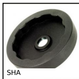
Volantin pieno, Poliammide