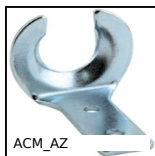
Aggancio per tirante chiusura in gomma, Aggancio