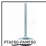
Piede fissabile con base lamiera Ø80, Ø 80