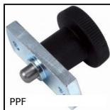
Pistoncino a molla, con flangia