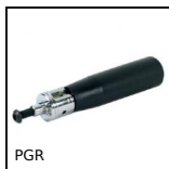
Impugnatura cilindrica libera retraibile, Retraibile