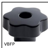
Volantino a 6 lobi - boccia passante, Duroplast - Ottone