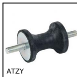
ATZY Antivibrante elastico sgolato, Acciaio