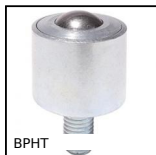
BPHT Sfera portante fissaggio con perno filettato, Forte