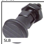
SLB Pistoncino a molla, acciaio classe 5.8