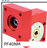
PF40NM Riduttore a ruota e vite senza fine, fino a