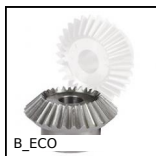
B_ECO Ingranaggio conico - Acciaio C43 - ECO, 1:1