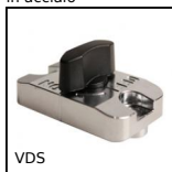
VDS Bloccaggio scorrevole per la regolazione,