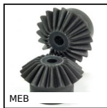
MEB Ingranaggio conico in plastica stampata, 1:1