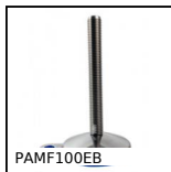
PAMF100EB Piede snodato con base stampata fissabile Ø100, Piede snodato