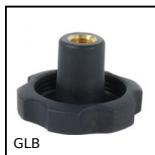
GLB Volantino a 6 lobi, Tecnopolimero - Ottone