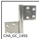
CHA_GC_14SS Cerniera a bandiera inox, Ad avvitare