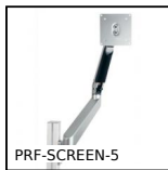
PRF-SCREEN-5 Screen support, Support with 5 axes of rotation