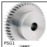
PSG1 Ingranaggio dritto di precisione, Acciaio 20NCD2 cementato temprato