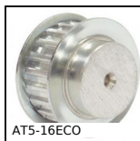
AT5-16ECO Puleggia dentata di posizionamento tipo AT, Serie economica - AT5 al...