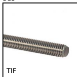
TIF Asta filettata - DIN975, Inox A2