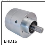
EHD16 Riduttore coassiale, da 210 a 380 Nm