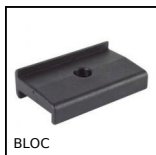
BLOC Accessori per porte, Arresto per porta