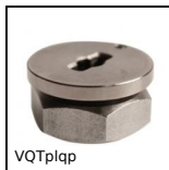
VQTplqp Chiusura ¼ di giro - Piastra di bloccaggio, Montaggio con controd...