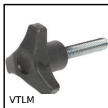
VTLM Volantino a 3 lobi, Poliammide - Acciaio