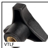
VTLF Volantino a 3 lobi, Poliammide - Ottone