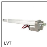
LVT Mini martinetto motorizzato 2A, 2 ampere