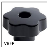
VBFP Volantino a 6 lobi - boccola passante, Duroplast - Ottone