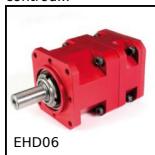
EHD06 Riduttore coassiale, da 8 a 19 Nm