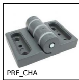
PRF_CHA Cerniera ad avvitare, Su facciata