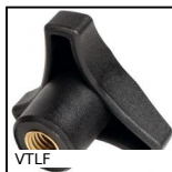
VTLF Volantino a 3 lobi, Poliammide - Ottone