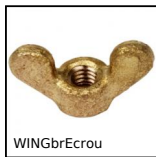
WINGbrEcrou Dado ad alette per serraggio manuale DIN315, Ottone DIN 315