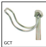
GCT Copiglia per tubo, Clip per tubo