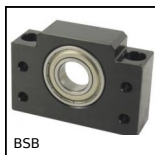
BSB Vite a ricircolo di sfere, Supporto