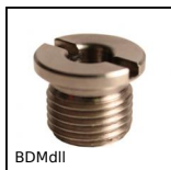
BDMdII Boccola magnetica per perno, Bloccaggio