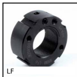
LF Cuscinetti a sfere - Accessorio, Ghiera di regolazione