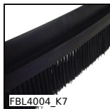
FBL4004_K7 Spazzola al metro fibre PA6 da Ø0,3 a Ø0,5, Poliammide nero 6 - me...