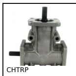
CHTRP Riduttore a rinvio angolare a L o a T, fino a 87,3 Nm