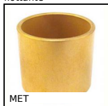
MET Cuscinetto cilindrico, Self-lubricating sintered bronze