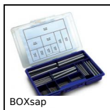
BOXsap Box kit di spine elastiche ISO8752,