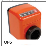
OP6 Indicatore di posizione digitale (N. di giri), 5 cifre