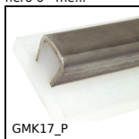
GMK17_P Guida prodotto laterale piatta, Per