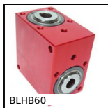
BLHB60 Rinvio angolare ad albero cavo, fino a 70 Nm