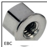
EBC Dado cieco Hygienic Design®, Compatto