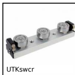
UTKswcr Guida lineare Utilitrack®, Carrello a rotelle acciaio