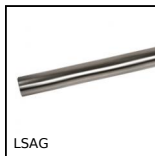
LSAG Albero scanalato a sfere, Binario - da 514 N a 15386 N