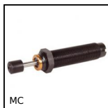
Deceleratore, autocompensante - senza regolazione