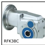
RFK38C Riduttore ipoide inox, fino a 200 Nm