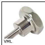
VML Volantino a lobi, Vite di pressione