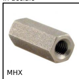
MHX Manicotto esagonale maschiato, Esagonale - inox