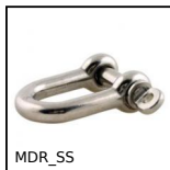
Grillo con chiodo ad occhiello, Inox