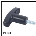
PGNT Impugnatura termoplastica a T, Con perno filettato