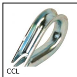
CCL Capocorda ad occhiello, Acciaio