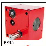
Riduttore a ruota e vite senza fine, da 2.20 a 4.10 Nm