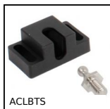
Sistema di chiusura, Blocca porta a sfera