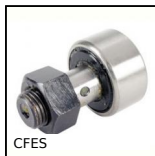
CFES Perno folle eccentrico, Eccentrico