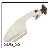
Supporto con tirante ad occhio, Inox