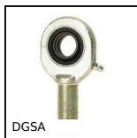
DGSA Testa a snodo maschio, Acciaio /