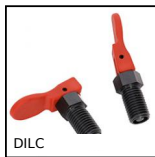
DILC Indexing plunger with cam, with cam