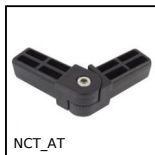
Giunto di collegamento, Ad angolo variabile