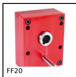
FF20 Riduttore ad alberi paralleli, da 5.80 a 23 Nm