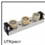
UTKpwcr Guida lineare Utilitrack®, Carrello a rotelle - rivestimento polimero