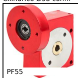
PF55 Riduttore a ruota e vite senza fine, fino a 57 Nm