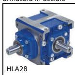
HLA28 Rinvio angolare a dentatura spiroidale, Fino a 182Nm