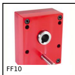
FF10 Riduttore ad alberi paralleli, da 0.78 a 3.70 Nm