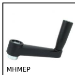
MHMEP Manovella ad impugnatura girevole, Prealesata