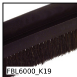
Spazzola al metro, Crine di cavallo nero