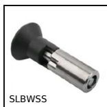
Pistoncino a molla, Da saldare - inox