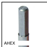
AHEX Riduttore manuale, Barra esagonale