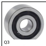
Q3 Cuscinetto a doppia corona di sfere, Obliquo - Acciaio