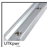
UTKpwr Guida lineare Utilitrack®, Profilo guida a V