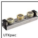
UTKpwc Guida lineare Utilitrack®, Ruota a V - rivestimento polimero