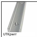
UTKpwr Guida lineare Utilitrack®, Profilo guida a V