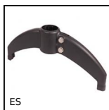
ES Simple support base (bipod), Plastic