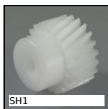
SH1 Ingranaggio elicoidale ad assi paralleli, Plastica lavorata (delrin)