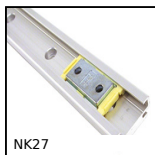
NK27 Guida mini Drylin® N, Larghezza 27 mm