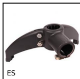
ES Bipod support base, Plastic