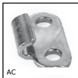
AC Piastrina di riscontro, 12mm