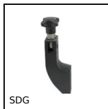
SDG Supporto con tirante ad occhio, Plastica