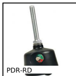
PDR-RD Piede con ruota integrata, Ruota disassata