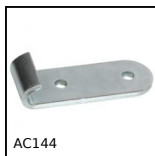
AC144 Piastrina di riscontro piatta per chiusura, 22mm