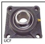
UCF Cuscinetto a flangia quadrata in ghisa, Ghisa