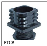
PTCR Adjustable furniture foot, square tube