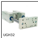
UGH32 Unità di guida tipo H, Per martinetti Ø 32