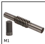
M1 Coppia ruota e vite senza fine , Acciaio temprato