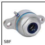
SBF Sealed flange bearing unit for Food Industry, cover