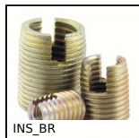
INS_BR Boccola autofilettante Ottone, Ottone