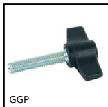
GGP Vite ad alette, Tecnopolimero con inserto in acciaio