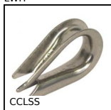
CCLSS Capocorda ad occhiello, Inox