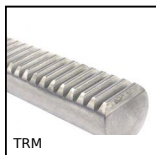
TRM Cremagliera sezione circolare, Acciaio - modulo 1-6