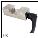
HK Accessorio di serraggio manuale, Serraggio manuale LWH