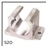
S20 Supporto corto per manicotto aperto a sfere, Aperto - corto