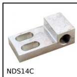
NDS14C Porta ventosa, Connettore angolare universale