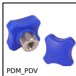
PDM_PDV Detectable plastic palm grip, blue thermoplastic