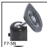
F7-SN Visualizzatore multifunzione, Supporto snodato