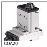
CQA20 Accessori per slitta di regolazione miniatura, 20