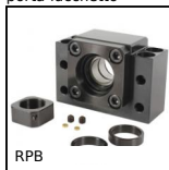
RPB Vite a ricircolo di sfere, Supporto