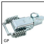
GP Chiusura a leva molla a trazione compensata, Con porta-lucchetto