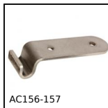
AC156-157 Riscontro per chiusura a leva rigida ad anello, 25.5mm