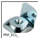
PRF_ECL_ Fissaggio, Dado quadrato con linguetta - Acciaio