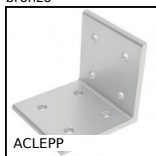
ACLEPP Angolare, 8 fori