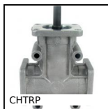
CHTRP Riduttore a rinvio angolare a L o a T,