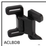
ACLBDB Sistema di chiusura per profili alluminio, Fermo a 2 sfere