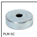
PLM-SC Magnete piatto con foro svasato. Con foro