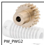
PW_PWG2 Ruota di precisione, Bronzo