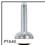
PTA40 Articulated foot with solid base foot Ø 40, 3000N