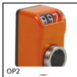
OP2 Indicatore di posizione digitale (N. di giri), 3 cifre