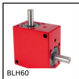
BLH60 Rinvio angolare a L, da 19 a 70 Nm