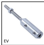
EV Terminale rapido inox per cavi,