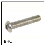
BHC Vite a testa bombata BHC , Inox A2