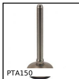
PTA150 Piede snodato con base stampata Ø150, 40000N