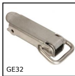
GE32 Chiusura a leva rigida ad anello, Standard