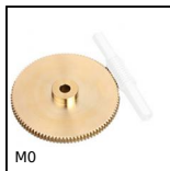
M0 Ruote per viti senza fine , Bronzo