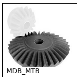
MDB_MTB Ingranaggio conico in plastica stampata ,