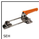
Attrezzo di bloccaggio a tirante, A tirante - inox