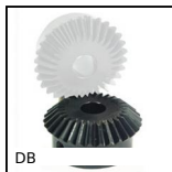
Ingranaggio conico in acciaio, 2:1