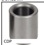
Boccola di posizionamento, Acciaio