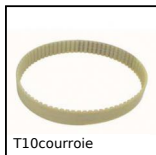
T10courroie Cinghia di posizionamento T, T10 Poliuretano armatura in acciaio