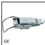
GE Chiusura a leva, Standard