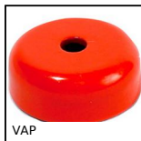
Magnete con foro centrale, Con foro centrale