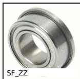
SF_ZZ Cuscinetto radiale a sfere, Inox