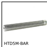
HTD5M-BAR Barra dentata per cinghia RPP, HTD5