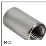
Manicotto di riduzione, Cilindrico - inox