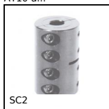
Giunto rigido in 2 parti, Ganascia di serraggio