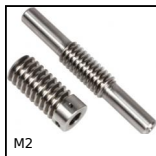
M2 Coppia ruota e vite senza fine, Acciaio non temprato