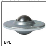
BPL Sfera portante con flangia, Leggero