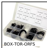
Valigetta di guarnizioni toriche in nitrile, 7.65 x 1.78mm a 37.82 x...