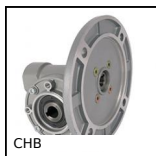
CHB Riduttore a ruota e vite senza fine, fino a 41 Nm