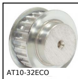
Puleggia dentata di posizionamento tipo AT, Serie economica - AT10 a...