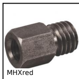
MHXred Manicotto di riduzione, Esagonale - acciaio