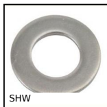
SHW Rondella semplice , Acciaio