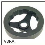
V3RA Volantino a tre razze, Poliammide