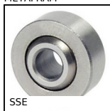
SSE Snodo sferico inox, Inox/PTFE