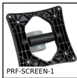
PRF-SCREEN-1 Screen support, Basic support