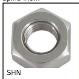
SHN Dado esagonale - DIN934, Acciaio (Class 6|8)