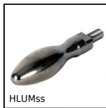
HLUMss Impugnatura girevole, Inox 316