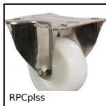
RPCplss Ruota fissa con piastra, Inox - Poliammide