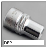
DEP Attrezzi Hygienic Usit® and Hygienic Design®, Bussole per il monta...