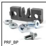
PRF_BP Maniglia e battuta per porta, Arresto per porta a battente