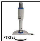
PTKFss Piede fissabile speciale agroalimentare, Stainless steel - 3-A