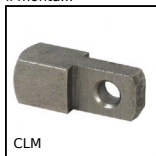
CLM Attacco per forcella, Corta inox