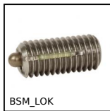
BSM_LOK Pressore a molla con esagono incassato, LONG-LOK - corpo e spina ino...