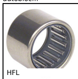
HFL Ruota libera, Combinata ad aghi