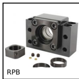
RPB Vite a ricircolo di sfere, Supporto