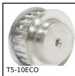
T5-10ECO Puleggia dentata di posizionamento tipo T, Serie economica - T5 allu...