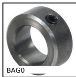
BAG0 Anello di bloccaggio, Acciaio