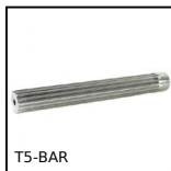
T5-BAR Barra dentata, T5