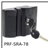
PRF-SRA-78 Sistema di chiusura per profili alluminio, Serratura rapida autobloc...