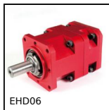
EHD06 Riduttore coassiale, da 8 a 19 Nm