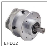
EHD12 Riduttore coassiale, da 60 a 140 Nm