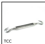
TCC Tenditore, Acciaio