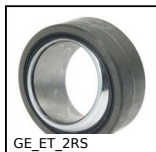
GE_ET_2RS Snodo sferico, Cromo duro/PTFE con guarnizioni di tenuta