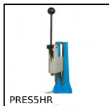
PRES5HR Pressa manuale da banco, Pressione fino a 500kg