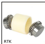
RTK Giunto Bowex®, a dentatura bombata, Nylon e acciaio