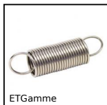
ETGamme Molla di trazione DIN2097, DIN 2097