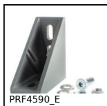
PRF4590_E Squadra di giunzione, PRF4590