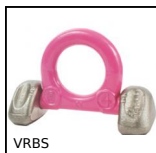
VRBS Anello di sollevamento, Articolato - a saldare