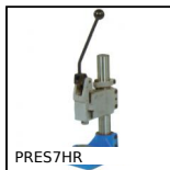
PRES7HR Pressa manuale da banco, Pressione fino a 700kg