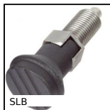
SLB Pistoncino a molla, inox