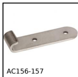
AC156-157 Riscontro per chiusura a leva rigida ad anello, 25.5mm