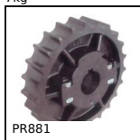
PR881 Ruota di rinvio, Serie 881