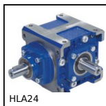
HLA24 Rinvio angolare a dentatura spiroidale, Fino a 78Nm