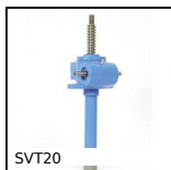
SVT20 Martinetto a vite - Vite traslante, Vite traslante