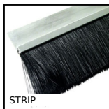
STRIP Spazzola strip, Lunghezza 3m