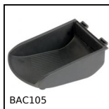
BAC105 Contenitore a becco, 8mm