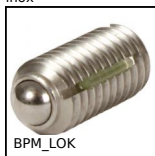
BPM_LOK Pressore a molla con intaglio e puntale a