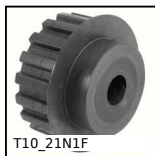
T10_21N1F Puleggia dentata di posizionamento tipo T, Serie economica - T10 nyl...