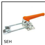
SEH Attrezzo di bloccaggio a tirante, A tirante - acciaio