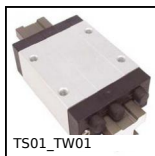
TS01_TW01 Guida lineare su binario Drylin® T, fino