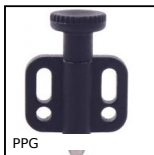
PPG Pistoncino a molla, Con flangia di fissaggio orizzontale