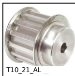
T10_21_AL Puleggia dentata di posizionamento tipo T, Serie economica - T10 all...