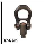
BABam Perno di sollevamento autobloccante,