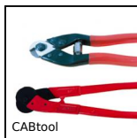
CABtool Attrezzi per cavi, Attrezzi per taglio