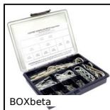
BOXbeta Box kit di spine beta, Box kit - beta