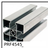
PRF4545 Profilato inox standard, 45 x 45 mm