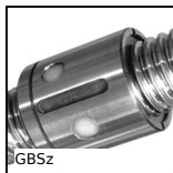
GBSz Vite a ricircolo di sfere, Dado cilindrico