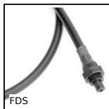
FDS Flexible drive shaft, Masterflex® Steel, with PVC casing