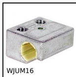
WJUM16 Pattino Drylin® W, Pattino