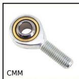
Testa a snodo maschio DIN ISO12240-4, Acciaio / bronzo