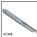
VCMB Vite di giunzione metallo/legno, Acciaio