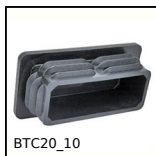
BTC20_10 Tappo per tubo rettangolare,