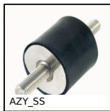
AZY_SS Antivibrante elastico cilindrico inox, Inox