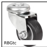
RBGtc Ruota girevole a foro centrale, Acciaio - gomma grigia