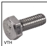
VTH Vite a testa esagonale, Acciaio classe 8.8