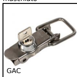
GAC Chiusura a leva con serratura, Bloccabile