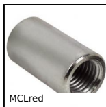
MCLred Manicotto di riduzione, Cilindrico -