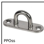
PPOss Piastrina con anello, Inox