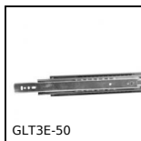
GLT3E-50 Guide telescopiche acciaio, Estensione extra