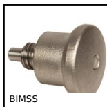
BIMSS Pistoncino a molla, Miniatura inox