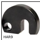
HAR9 Rondella girevole, DIN 6371