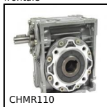
CHMR110 Riduttore a ruota e vite senza fine, fino a 980 Nm