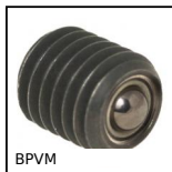
BPVM Sfera portante avvitabile miniatura, Miniatura ad avvitare