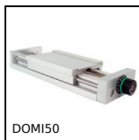
DOMI50 Slitta di regolazione Domino 50, Slitta DOMILINE 50 con contatore e ...