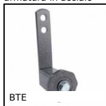
BTE Tenditore automatico universale, Per applicazioni correnti