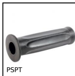
PSPT Manopola a pressione, PVC