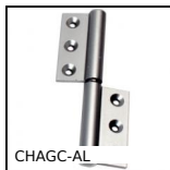
CHAGC-AL Cerniera ad avvitare, Sfilabile