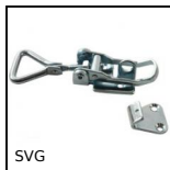
SVG Chiusura a leva regolabile, Corsa da 118mm a 130,5mm