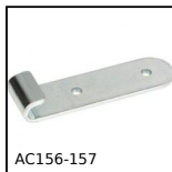
AC156-157 Riscontro per chiusura a leva rigida ad anello, 25.5mm