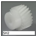
SH2 Ingranaggio elicoidale ad assi paralleli, Plastica lavorata (delrin)