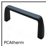
PCATherm Maniglia a ponte, Thermoplastic