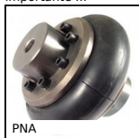
PNA Giunto elastico PERIFLEX®, Giunto completo