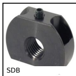
SDB Pistoncino a molla - Supporto, fissaggio perpendicolare alla serratura