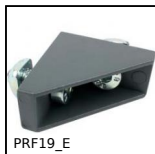
PRF19_E Squadra di giunzione, PRF19 a PRF32