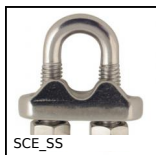
SCE_SS Serracavo, Inox