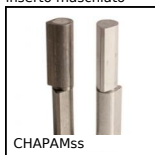
CHAPAMss Cerniera a testa piatta a saldare, Inox o Alluminio