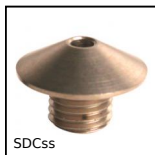
SDCss Boccole di posizionamento per pistoncino a molla, Per puntale da Ø4...