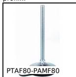
Piede fissabile con base lamiera Ø80, Ø 80