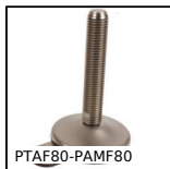
PTAF80-PAMF80 Piede fissabile con base lamiera Ø80, Ø 80