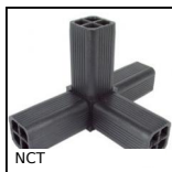
NCT Giunto di collegamento, Ad angolo fisso