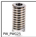
Vite senza file di precisione, Acciaio