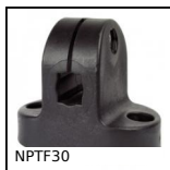
NPTF30 Morsetto di collegamento, Fisso Ø14 a Ø20