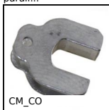
CM_CO Attrezzi Hygienic Usit® and Hygienic Design®, Protective inserts f...