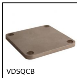
Bloccaggio scorrevole per la regolazione, Piastra di base per profil...