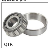
QTR Cuscinetto a rulli conici, Acciaio