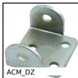
ACM_DZ Base per tirante chiusura in gomma, Base