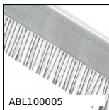
ABL100005 Spazzola antistatica, Standard