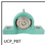
Cuscinetto ritto polimero inox, polimero e inox