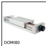
DOMI80 Slitta di regolazione Domino 80, Slitta DOMILINE 80 con contatore e ...