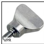
Vite ad alette Hygienic Usit®, Inox