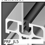
PRF_JL5 Panel accessories, Guarnizione - Ø 5mm