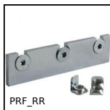
PRF_RR Elementi di giunzione, Piastra di raccordo