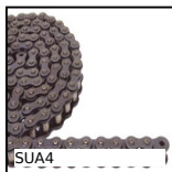
Catena semplice al metro, Acciaio