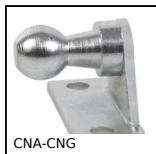
CNA-CNG Staffa di montaggio per molla a gas, Staffa di montaggio a squadra p...