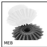
Ingranaggio conico in plastica stampata, 1:1