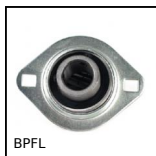
Supporto a flangia ovale con cuscinetto, Lamiera