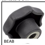
BEAB Manopola, stella, anti- bacterial