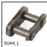
Giunzione per catena al metro, Maglia di giunzione - acciaio