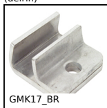
GMK17_BR Morsetto porta guide, Conico singolo