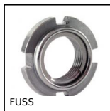
FUSS Ghiera autofrenante per cuscinetto, Ghiera autofrenante - rondella i...