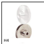
H4 Ingranaggio elicoidale ad assi incrociati a