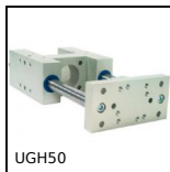
UGH50 Unità di guida tipo H, Per martinetti Ø 50