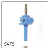
SVT5 Martinetto a vite - Vite traslante, Vite traslante