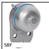
SBF Sealed flange bearing unit for Food Industry, cover