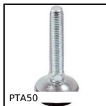
PTA50 Piede snodato con base stampata Ø50, Ø 50