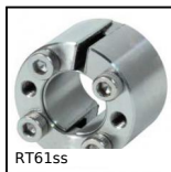
RT61ss Calettatore di bloccaggio, Coppia media/bassa