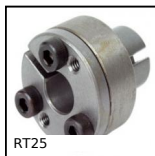
RT25 Calettatore di bloccaggio, Coppia media/elevata