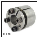
RT70 Calettatore di bloccaggio, Coppia media/elevata