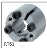
RT61 Calettatore di bloccaggio, Coppia media/bassa