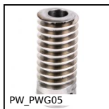
PW_PWG05 Vite senza fine di precisione, Acciaio