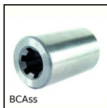
BCAss Boccola scanalata Inox, Inox