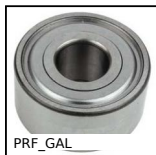
PRF_GAL Rotella per profilo alluminio, Rotella liscia