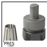
PRES Accessori per pressa PRES-3HR e PRES-4HR, Portapinzine