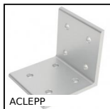
Angolare, 8 fori