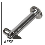
Perno di fissaggio, con chiusura a scatto