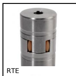
Rotex®, elastico, acciaio