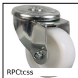
Ruota girevole a foro centrale, Inox - Poliammide