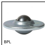
Sfera portante con flangia, Leggero