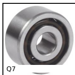
Cuscinetto obliquo a sfere, Acciaio