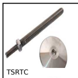
Stem support for caster, For swivel caster with central hole