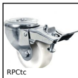
Ruota girevole a foro centrale, Acciaio - Poliammide - a doppio bloc...