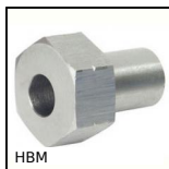
Guida su semi-binari, Boccola di regolazione