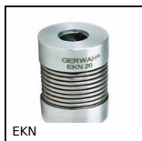
Giunto a soffietto Gerwah®, da 0.5 a 12Nm