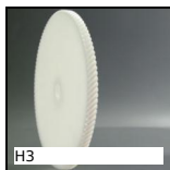
Ingranaggio elicoidale ad assi incrociati