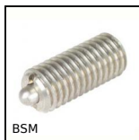
BSM Pressore a molla con esagono incassato,