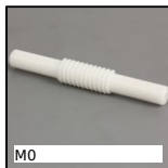
M0 Coppia ruota e vite senza fine , Plastica lavorata (delrin)