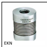
EKN Giunto a soffietto Gerwah®, da 0.5 a