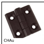
CHAU Cerniera ad avvitare, 270°