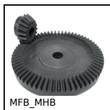
MFB_MHB Ingranaggio conico in plastica stampata, 4:1