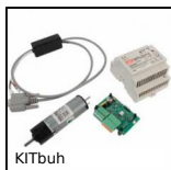
KITbuh Kit di motorizzazione 24V, Planetario