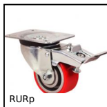
RURp Ruota girevole a doppio bloccaggio, Poliuretano - Mozzo alluminio (U...