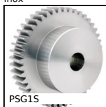
PSG15 Ingranaggio dritto di precisione, Inox 303