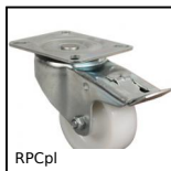
RPCpl Ruota girevole a doppio bloccaggio, Acciaio - poliammide