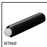
NTMdl Grano punta in delrin, punta in delrin