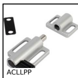
ACLLPP Sistema di chiusura, Chiusura a molla