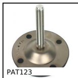
PAT123 Piede snodato con base lamiera Ø123, Ø 123