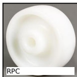
RPC Ruota, Poliammide