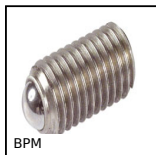
BPM Pressore a molla con intaglio e puntale a sfera, Inox 303