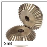
SSB Ingranaggio conico inox, 1:1