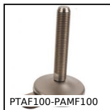
Piede fissabile con base lamiera Ø100, Ø 100