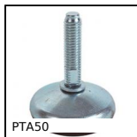
Piede snodato con base stampata Ø50, 4000N