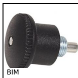
Pistoncino a molla, miniatura