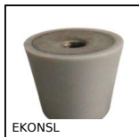
Piedino antivibrante conico silicone, Fissaggio femmina