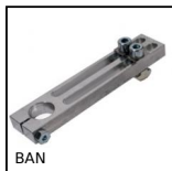
Connettore / supporto per profili alluminio, Regolabile