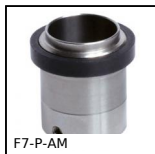
Visualizzatore multifunzione, Anello magnetico