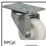
Ruota girevole con piastra, Acciaio - Poliammide