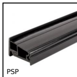
Accessori per pannello, Profilo supporto per pannelli