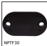
Morsetto di collegamento, Distanziale Ø14 a Ø20