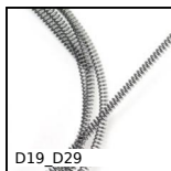
Molla di compressione al metro inox, al metro