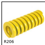
Molla per stampi ISO10243, Extra-forte