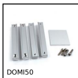
DOMI50 Kit di raccordo, Kit di raccordo XY