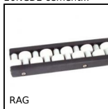
RAG Guida di scorrimento a rullini,