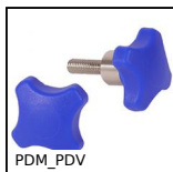
PDM_PDV Detectable plastic palm grip, blue thermoplastic