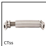
CTss Giunto cardanico telescopico inox, Sollecitazioni leggere