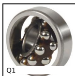
Q1 Cuscinetto orientabile a sfere, Acciaio