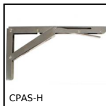
CPAS-H Squadra pieghevole, Per carico pesante