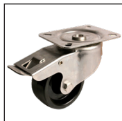
Girevole doppio bloccaggio