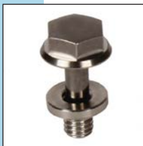
Washer with VHTM screw