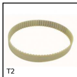
T2 Cinghia di posizionamento T, T2.5 Poliuretano armatura in acciaio