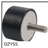
DZYSS Piedino antivibrante cilindrico inox, inox