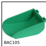
BAC105 Contenitore a becco, 8mm