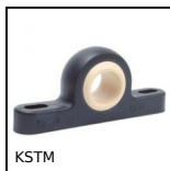
KSTM Supporto ritto con cuscinetto Igubal®, Polimero