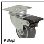
RBGpl Ruota girevole a doppio bloccaggio, Acciaio - gomma grigia