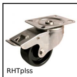
RHTplss Ruota alte temperature, fino a 200kg