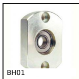
BH01 Cuscinetto radiale flangiato, Montaggio : pressione e colla