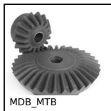
MDB_MTB Ingranaggio conico in plastica stampata, 2:1