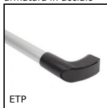
ETP Maniglia e battuta per porta, Modulare