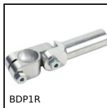
BDP1R Braccio di reazione, Serraggio standard