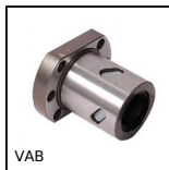
VAB Flanged nut for ball screw, For VAB ballscrew