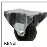
RBNpl Ruota fissa con piastra, Acciaio - caucciù