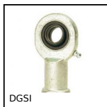
DGSI Testa a snodo femmina, Acciaio / acciaio - Serie