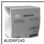
ALIDRP240 Alimentazione, 10 A