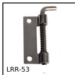
LRR-53 Chiavistello con bloccaggio, Lucchetto a molla inox