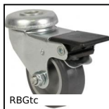
RBGtc Ruota girevole a foro centrale, Acciaio - gomma grigia - a doppio bl...