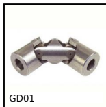
GD01 Giunto cardanico doppio, Sollecitazioni normale