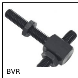
BVR Battute a vite regolabile, Acciaio