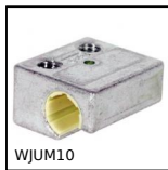
WJUM10 Pattino Drylin® W, Pattino