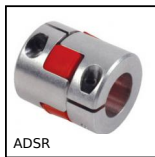
ADS R Giunto senza gioco Gerwah®, da 12.5 a 525Nm