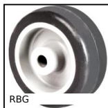
RBG Ruota, Rivestimento in gomma - nucleo in polipropilene