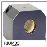
RJUM05 Supporto per boccola Drylin R®, Chiuso - Lungo