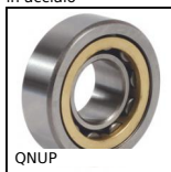
QNUP Cuscinetto a singola corona di rulli cilindrici, Anello