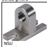
NSU Supporto per sensore, Morsetto universale base a 90°