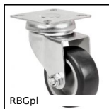
RBGpl Ruota girevole con piastra, Acciaio - gomma grigia