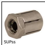
SUPss Calettatore di bloccaggio autocentrante inox, Senza ghiera