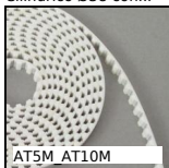
AT5M AT10M Cinghia aperta al metro tipo AT, AT5 Poliuretano armatura in acciaio