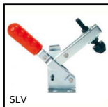
SLV Attrezzo di bloccaggio a leva verticale, A leva verticale - acciaio