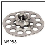
MSP38 Inserto con piastrina a incollare Masterplate®, Cilindrico Ø38 con...