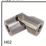
H02 Giunto cardanico semplice ad aghi,