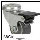
RBGtc Ruota girevole a foro centrale, Acciaio - gomma grigia - a doppio bl...