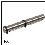
PX Riduttore a ruota e vite senza fine, Albero semplice in uscita per r...