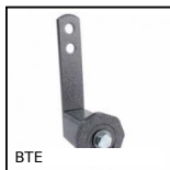
BTE Tenditore automatico universale, Per applicazioni correnti