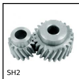
SH2 Ingranaggio elicoidale ad assi paralleli,