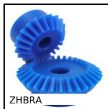
ZHBRA Ingranaggio conico in plastica, 1,25:1 2:1 3:1