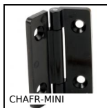
CHAFR-MINI Cerniera, A frizione