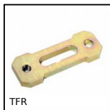
TFR Tenditore rigido, Fisso