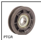
PTGR Puleggia folle, Per cinghia tonda