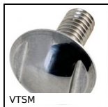
VTSM Ball head screws Hygienic Design®, Inox