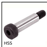
HSS Vite a spalla di precisione ISO7379, Acciaio trattato classe 12.9