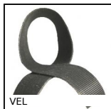
VEL Rotolo a strappo fermacavi, cavi elettrici e pneumatici