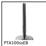
PTA100ssEB Piede snodato con base stampata Ø100, Piede snodato