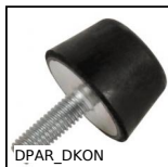
DPAR_DKON Piedino antivibrante parabolico, Acciaio