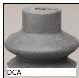
DCA Ventosa, Gomma naturale