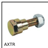
AXTR Puleggia folle, Perno