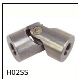
H02SS Giunto cardanico semplice ad aghi - inox, Sollecitazioni importante ...