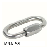
MRA_SS Maglia rapida, Inox