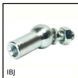
IBJ Snodo angolare a 180°, Acciaio