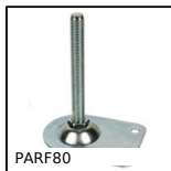
PARF80 Piede senza snodo, Piede snodato oscillante fissabile Ø80