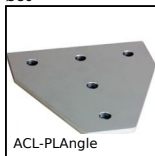
ACL-PLAngle Elementi di giunzione, Collegamento angolare