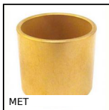
MET Cuscinetto cilindrico , Bronzo autolubrificante METAFRAM