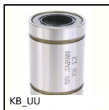
KB_UU Manicotto a sfere di precisione, Di precisione - acciaio