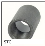
STC Deceleratore, Ghiera d'arresto