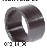
OP3_14_06 Accessorio per indicatori, Boccola di riduzione