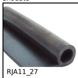
RJA11_27 Guarnizione in gomma, Diverso dall'aggancio