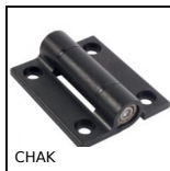
CHAK Cerniera, Hi-Klik™ - di posizionamento