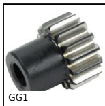
GG1 Ingranaggio dritto rettificato, Acciaio trattato