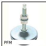
PFM Piede senza snodo, Lamiera modellata