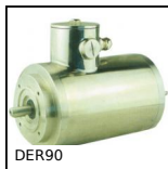
DER90 Motore inox AC asincrono da 1,1 a 1,5kW, 1.1 a 1.5kW