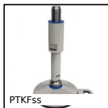
PTKFss Piede fissabile speciale agroalimentare, Stainless steel - 3-A