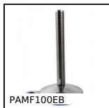
PAMF100EB Piede snodato con base stampata fissabile Ø100, Piede snodato