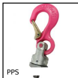
PPS Anello di sollevamento, Gancio universale ad avvitare