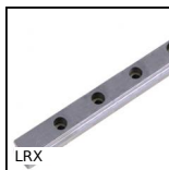
LRX Guida lineare a rulli, Binario - da 9410 N a