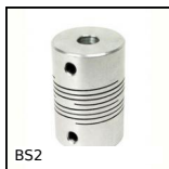
BS2 Panamech, Multi-Beam, Alluminio - con