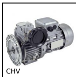
CHV Motovariatore meccanico, da 0,18 a 1,5kW